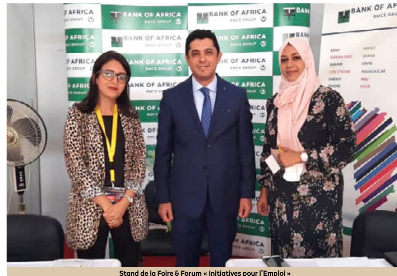
Stand de la Foire & Forum « Initiatives pour l'Emploi »