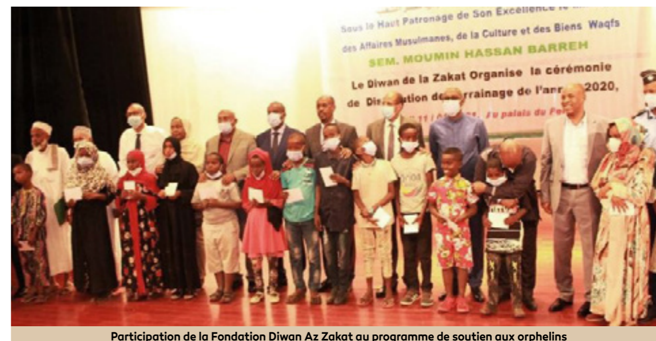
Participation de la Fondation Diwan Az Zakat au programme de soutien aux orphelins