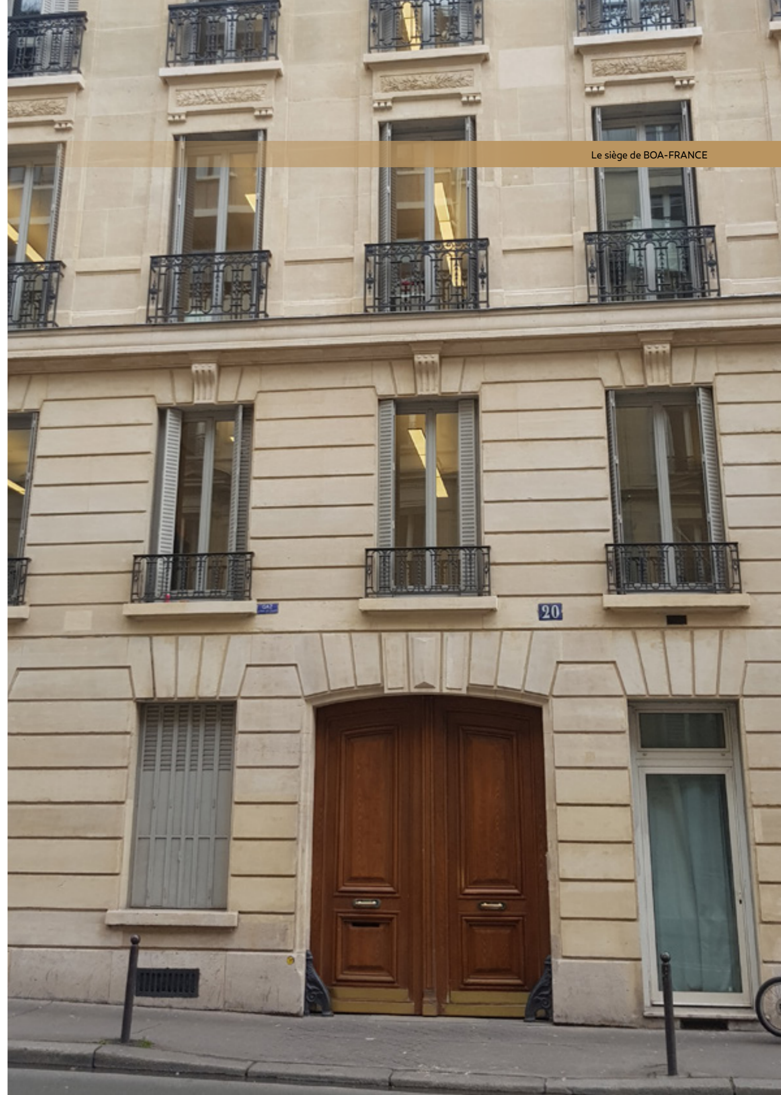
Le siège de BOA-FRANCE

20, Rue de Saint Petersburg 75008 Paris - FRANCE Tél. : +(33) 1 42 96 11 40 Fax. : +(33) 1 42 96 11 68