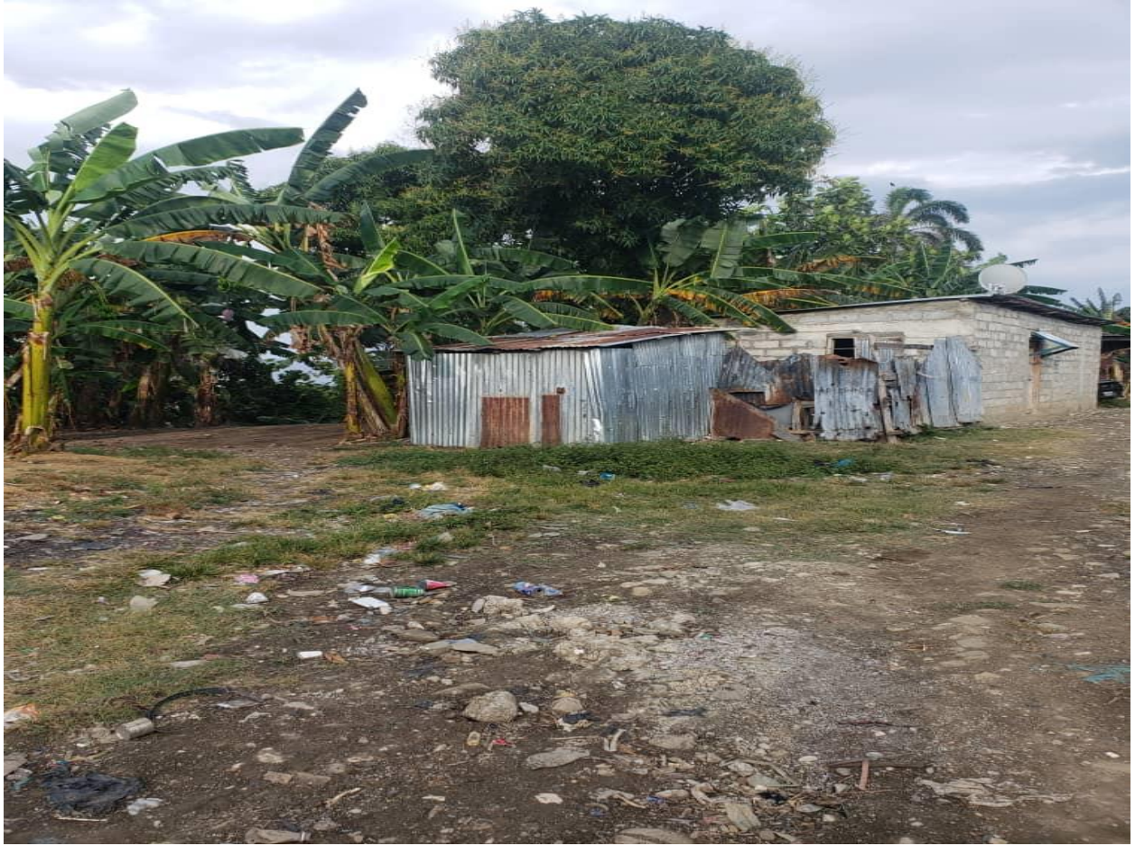
maison présente sur le terrain