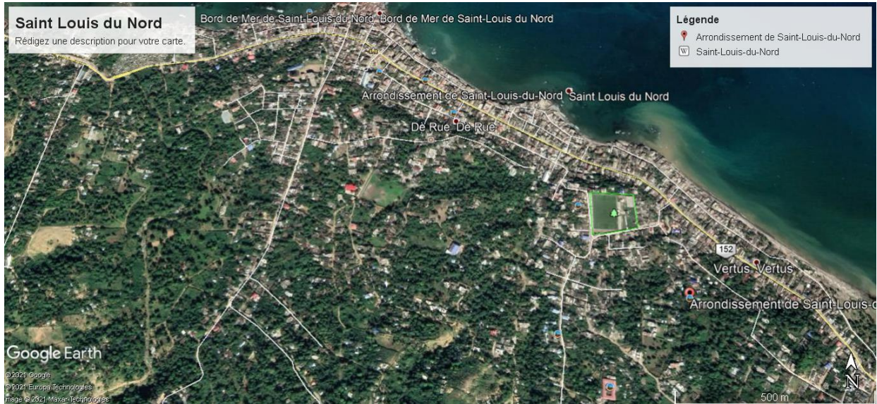
Figure 3-1: Image satellite 2020 de la ville de Saint Louis du Nord

La commune de Saint-Louis du Nord est située dans le Département du Nord-Ouest, dans la sous-région communément appelée Haut Nord-Ouest. Il s'agit d'une zone montagneuse, à l'extrémité du Massif du Nord. C'est aussi une région côtière, faisant face au Canal de la Tortue. D'une superficie de 125,6 km 2 , la commune de Saint-Louis du Nord est subdivisée en un bourg (ou ville) et 6 sections communales. Les Champs d'interventions du projet se localisent au centre-ville de Saint Louis du Nord, plus précisément à Haut Fort rue l'Hôpital localité communément appelée Sous Fort.