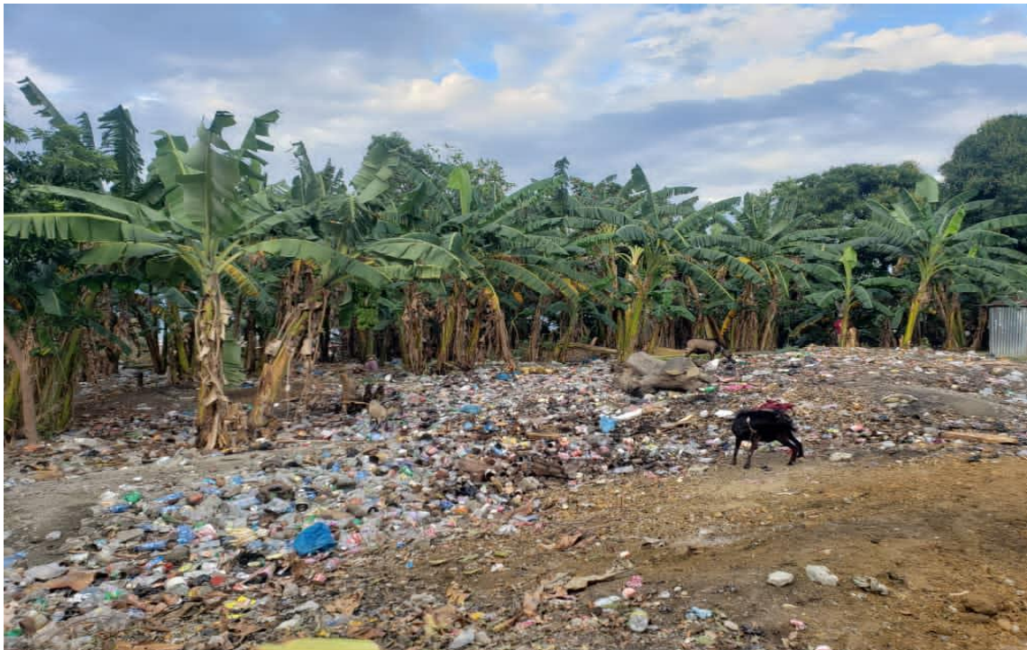
Figure 3-3 : Photographie du Terrain