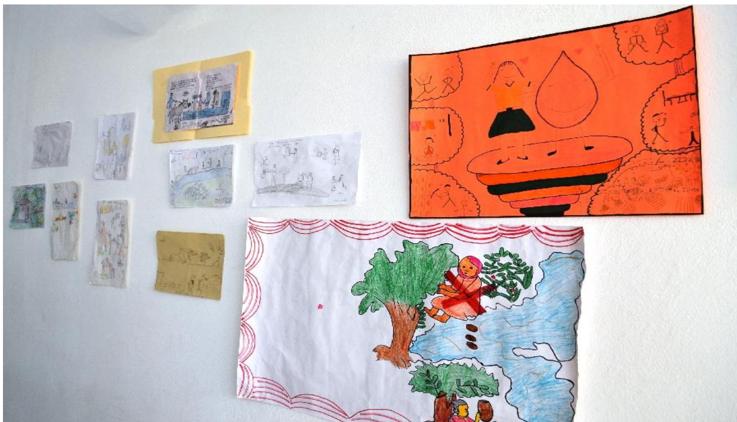
Exposition des meilleurs dessins du concours

Conception graphique et réalisation Stéphane Lacroix Reportage Vidéo : Luckenson Auguste Production Département de Communication DINEPA