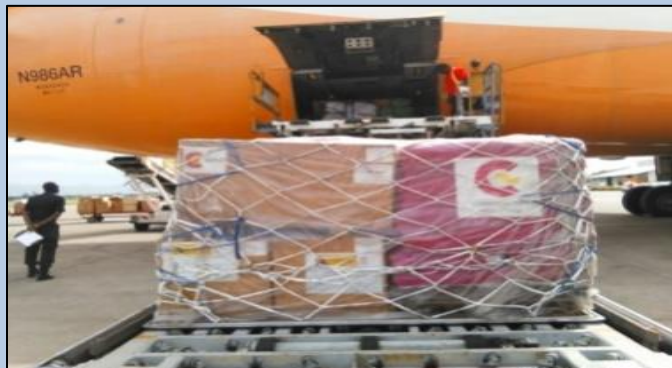
Réception de matériels à l'aéroport national Mais Gâté