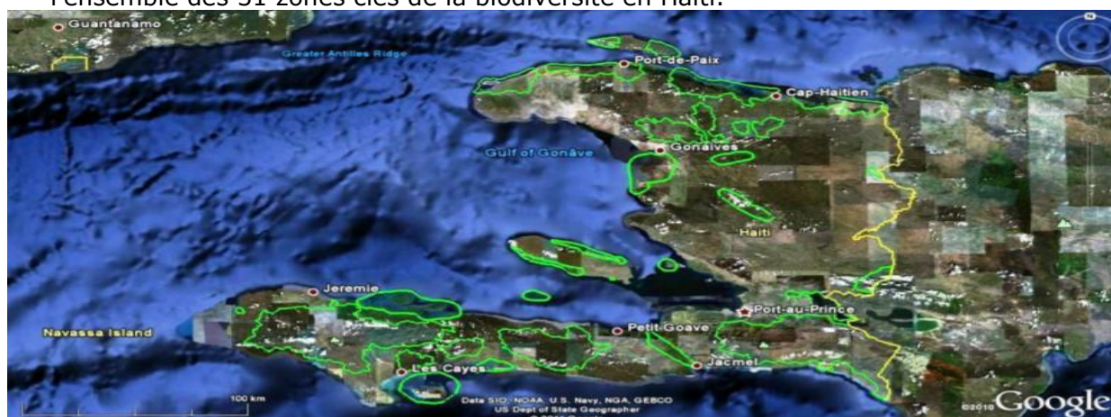
Figure 1: Distribution des 31 zones clés de la biodiversité en Haïti (Gouvernement de la République d'Haïti, 2016)