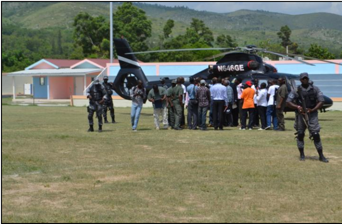
L'hélicoptère présidentiel vient d'atterrir