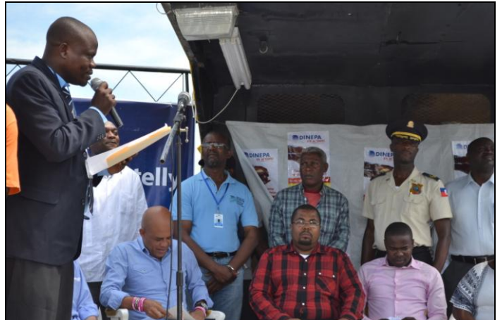
Discours du Maire