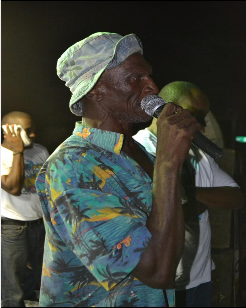
Ce vieillard exprime sa satisfaction, il affirme que l'Eau potable est pour la première fois une réalité à Verettes