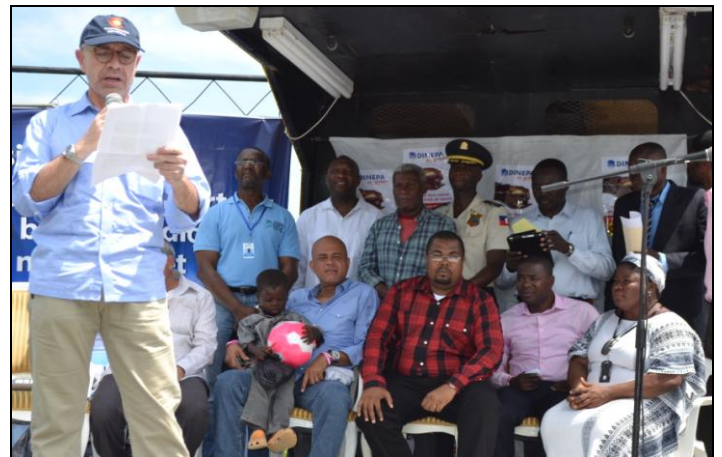
Discours de l'Ambassadeur d'Espagne

INAUGURATION DU RESEAU D'EAU POTABLE DE VERETTES