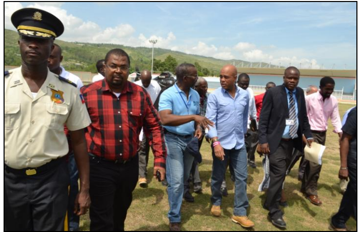
Le Directeur général accueille le Président