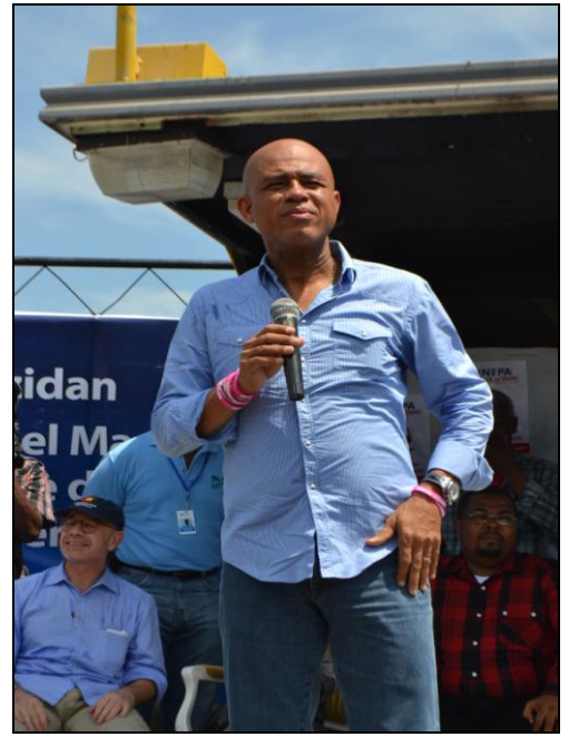
Discours du Président Martelly