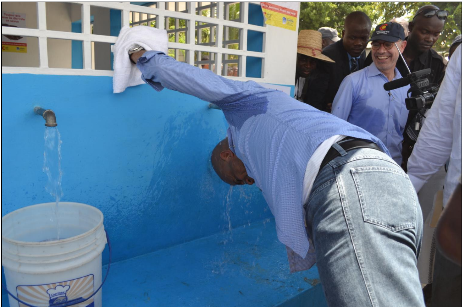
Aux alentours de Midi – Il fait très chaud. Le Président Martelly devant l'un des kiosques de distribution