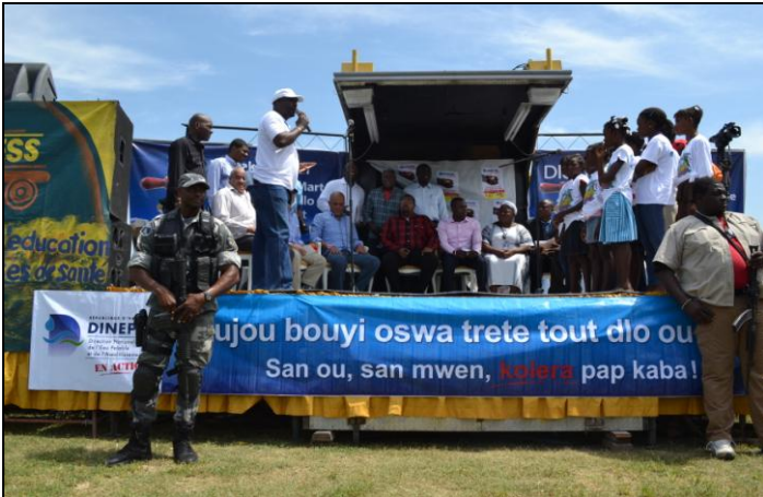
Chant de bienvenue par une chorale d'enfants