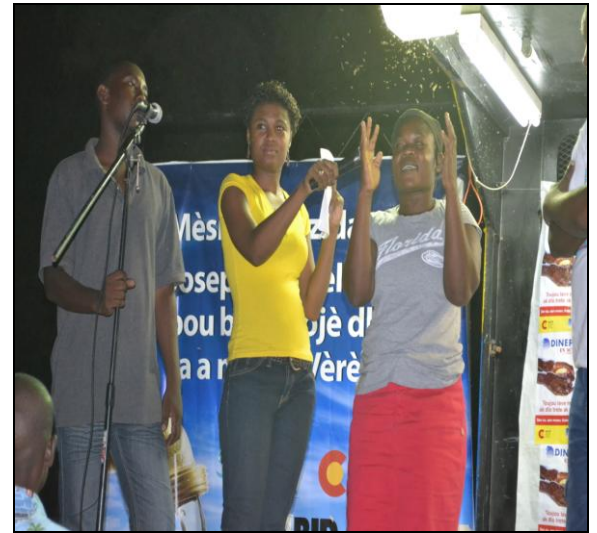
Jeux questions réponses Comment se laver les mains ?